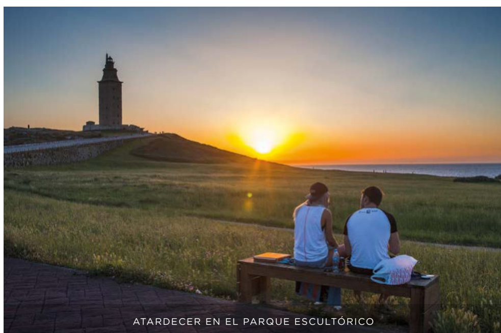
ATARDECER EN EL PARQUE ESCULTÓRICO